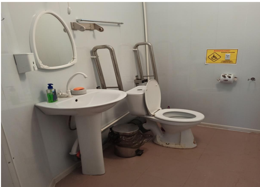
Оборудованное санитарно - гигиеническое помещение